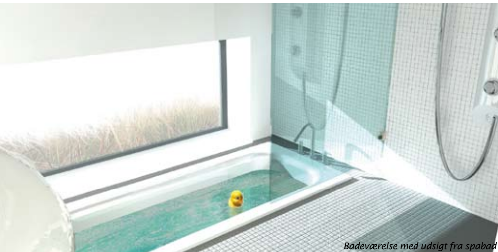
Badeværelse med udsigt fra spabad