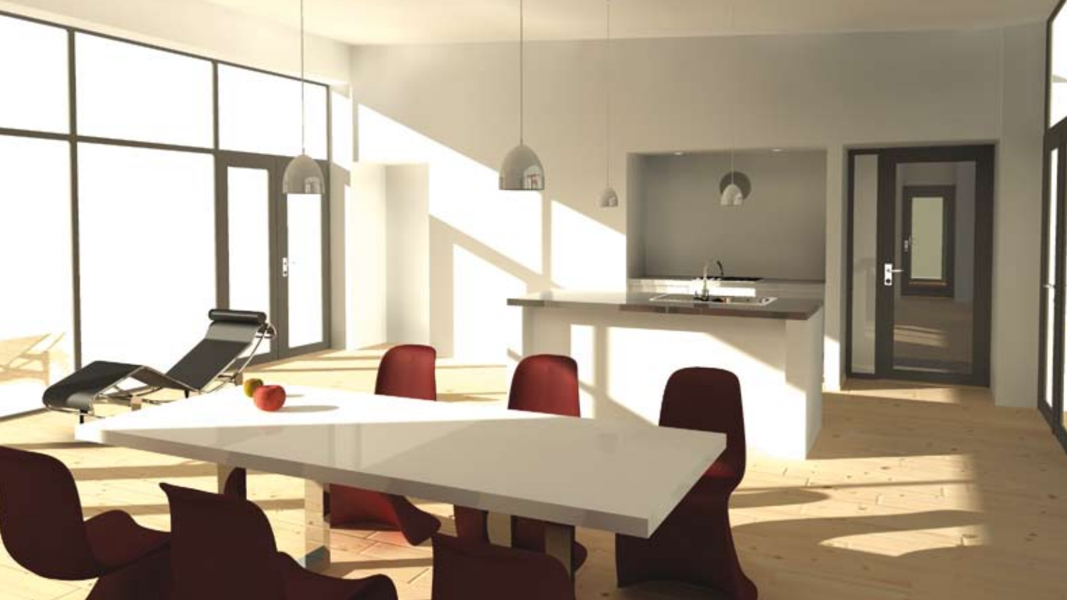
Husets hjerte med kontakt til gården og udsigtsterrasse

~ FIT' LØVE ER IKKE NOK. SOLSKIN, FRIHED OG EN LILLE BLØMST' MÆT MÆT HÆ~